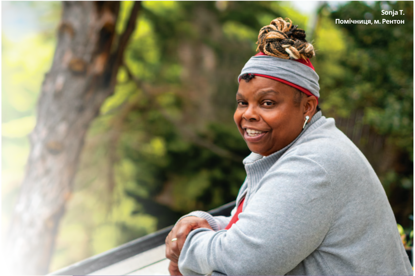
Помічниця, м. Рентон